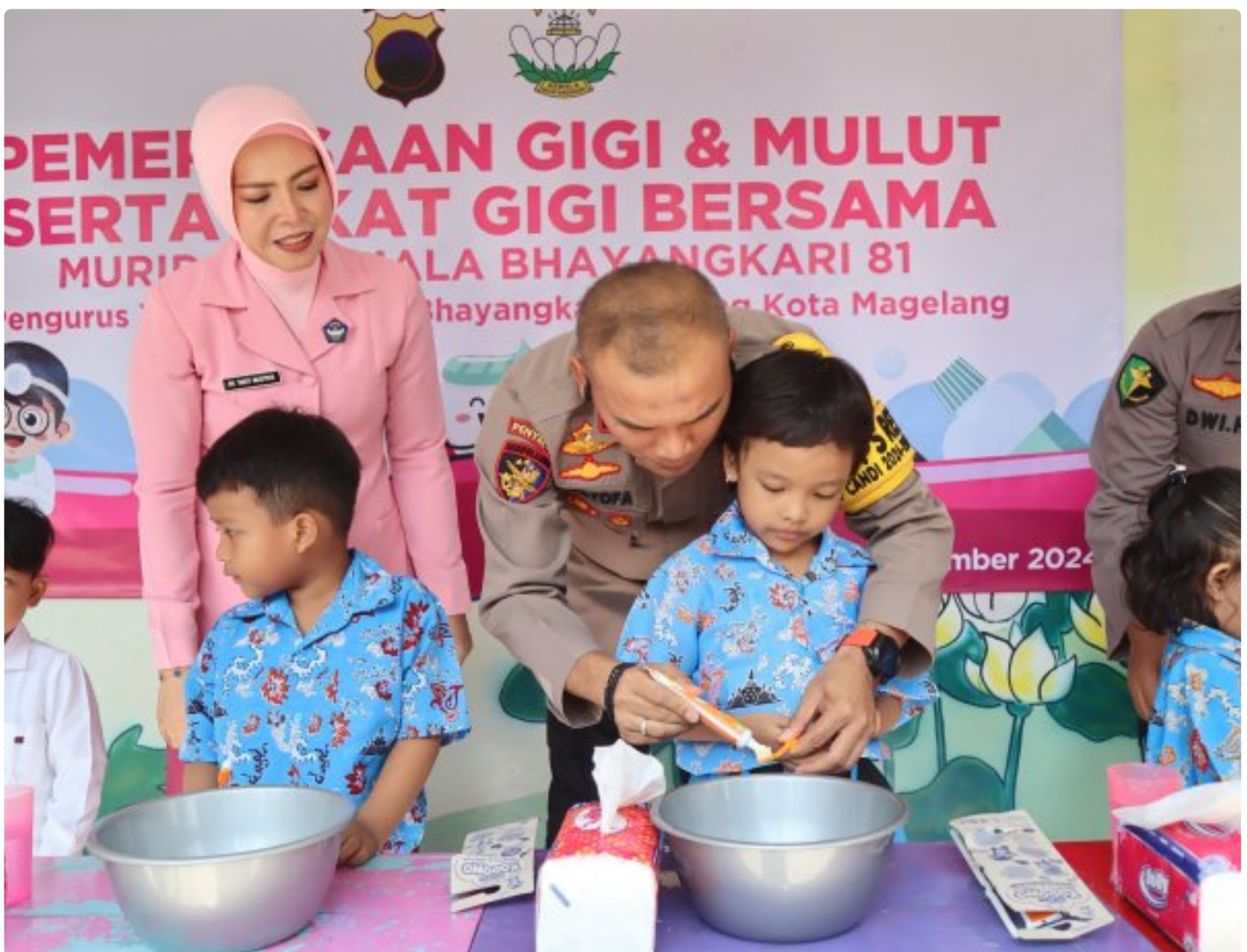
Foto: Bhayangkari Cabang Kota Magelang kembali menunjukkan kepeduliannya terhadap kesehatan anak-anak dengan menggelar Sosialisasi Kesehatan Gigi dan Mulut di TK Kemala Bhayangkari 81 Magelang, Selasa (5/11/2024).

Magelang- Bhayangkari Cabang Kota Magelang kembali menunjukkan kepeduliannya terhadap kesehatan anak-anak dengan menggelar Sosialisasi